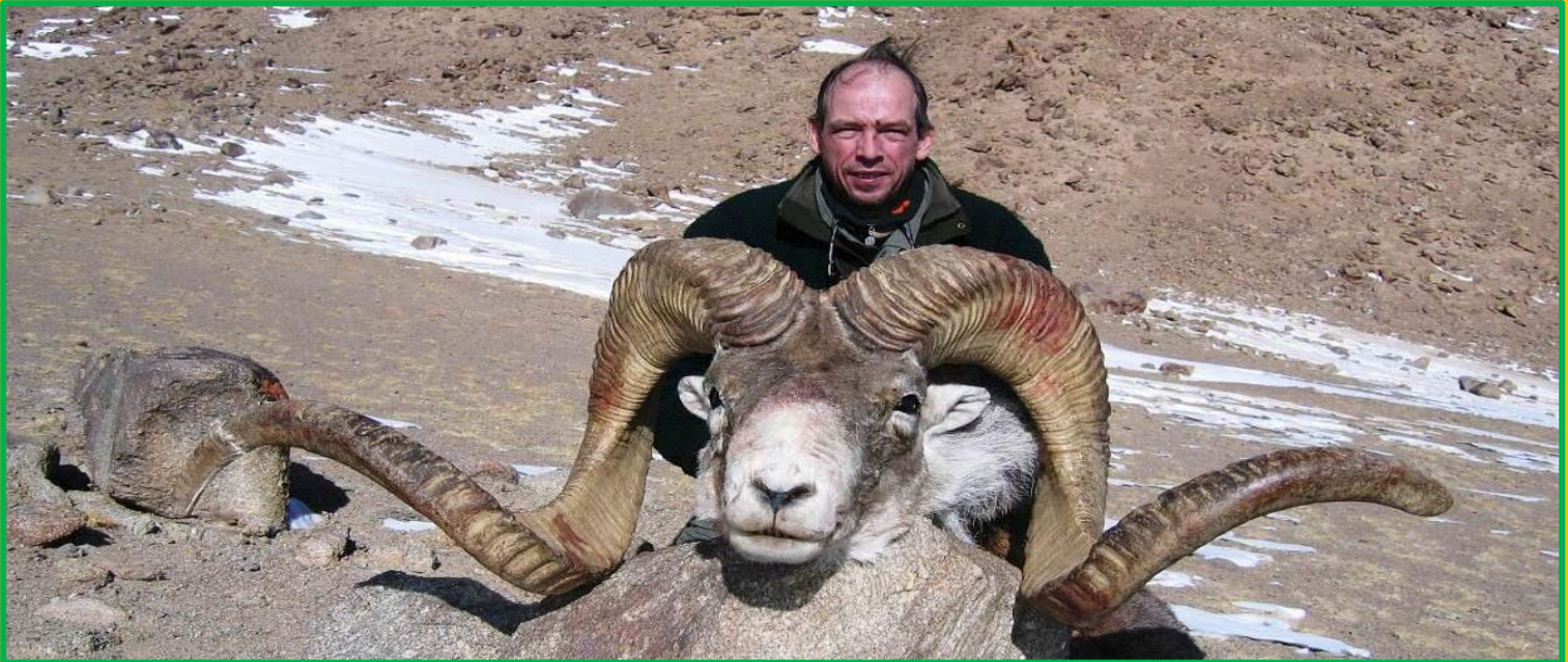
Hochkapitaler Widder mit 65 Inch erlegt von einem unserer Jagdgäste im Zuge der bestätigten Jagd auf kapitale Widder