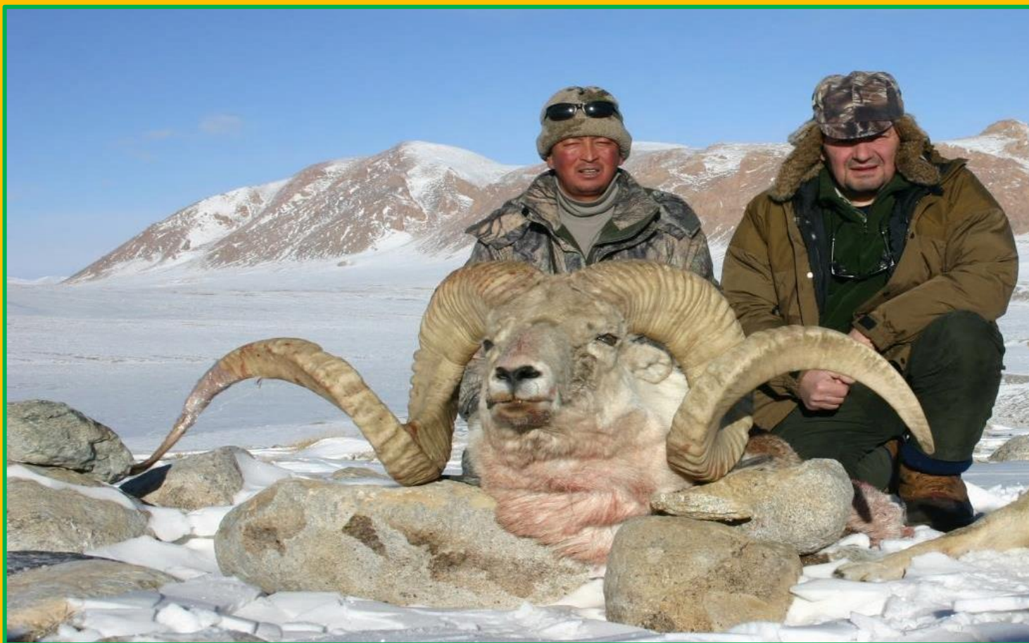
Kapitales Marco Polo mit 63 Inch Hornlänge, erlegt von einem unserer Jagdgäste im Zuge einer Jagd auf bestätigte Kapitalwidder

Nunmehr genügt nicht mehr nur die Vorlage eines gültigen CITES (Trophäenursprungs- und Verkehrszeugnis), sondern vor der Einfuhr muss auch eine Einfuhrgenehmigung beim zuständigen Bundesamt eingeholt werden - was auf Wunsch des Jagdgastes von uns erledigt werden kann.