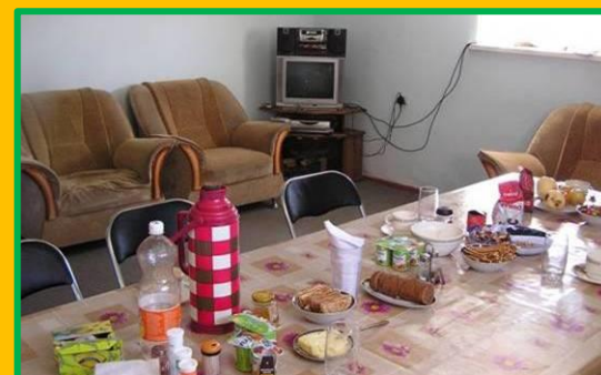
Eine der Jagdhütten im Jagdgebiet am Karakul See