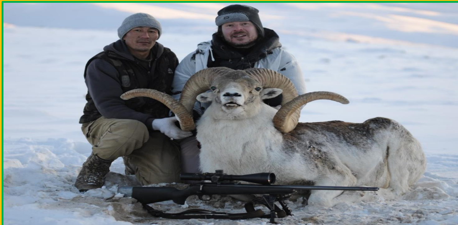
Marco Polos haben mit ihrer Deckenfarbe im schneefreien Gelände eine optimale Tarnung. Bitte beachten Sie den kapitalen Widder links im Bild!

Alle in Verbindung mit einer vorzeitigen oder späteren Abreise verbundenen Kosten wie Gebühren für Umbuchung der Flüge und ev. Hotelnächtingen sind vom Jagdgast zu zahlen.