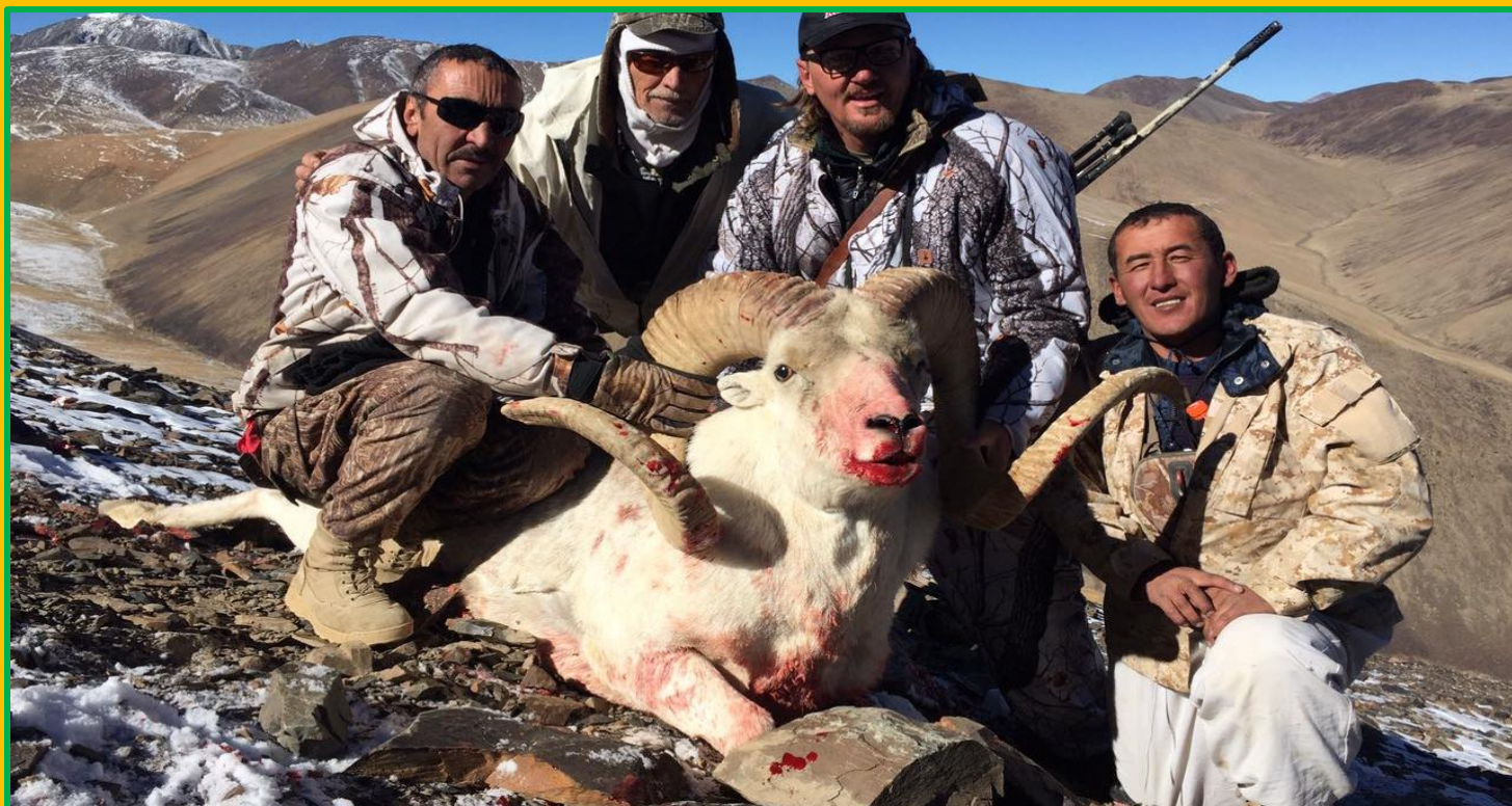
Sehr guter Widder mit massigen, 58 Inch langen Schneckens - erlegt bei der Standardjagd