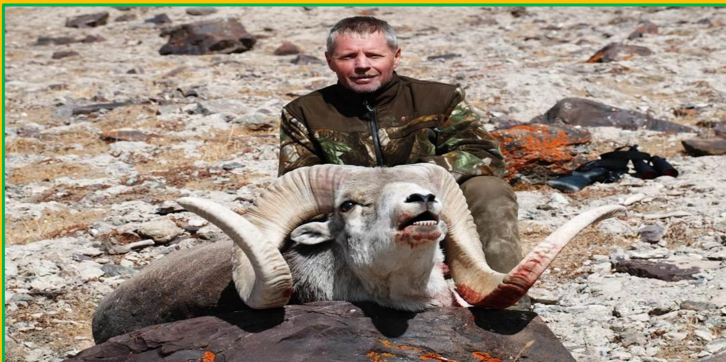
Im Bild oben einer unserer Jagdgäste mit einem guten 54 Inch Marco Polo. Unten - Marco Polos äugen sehr gut, daher ist eine entsprechende Tarnung unverzichtbar.